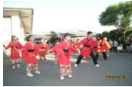
かほうきしょうたい 賀宝燦翔隊