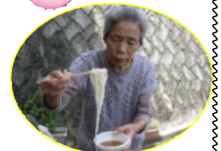
皆で作ると楽しいな～