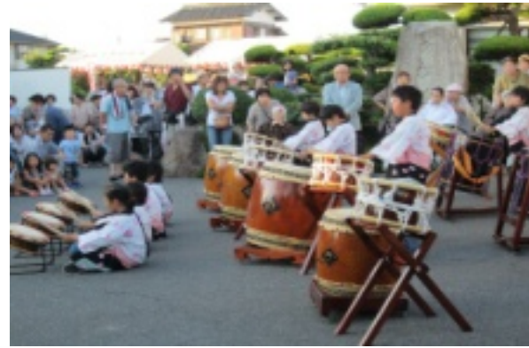
すおうちどりだいこほぞんかい 周防千鳥太鼓保存会