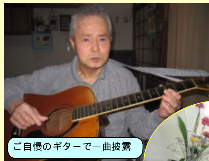
ご自慢のギターで一曲披露