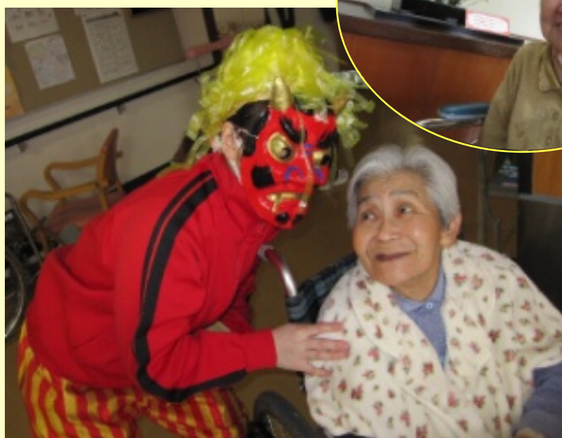
可愛い鬼と福の神