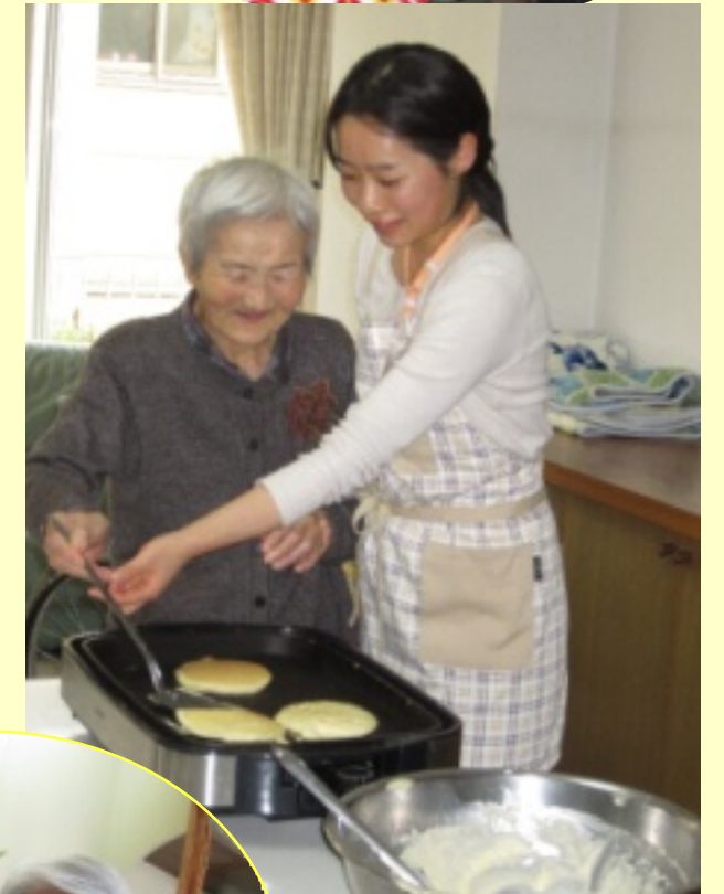
美味しいホットケーキ作り