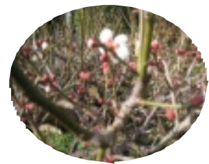
白松苑玄関前の梅

〒754-1277 山口市阿知須5044番地1 TEL 0836-65-2250 FAX 0836-65-4645