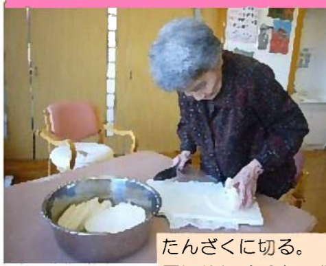
たんざくに切る。厚切りにすると日数がかかるので、出来れば細切りで！