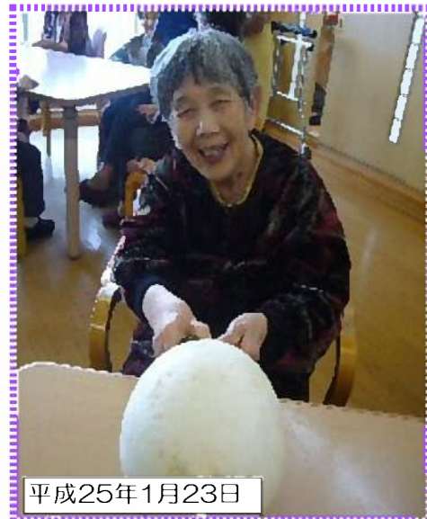
聖護院大根、又は普通の長い大根でもOK