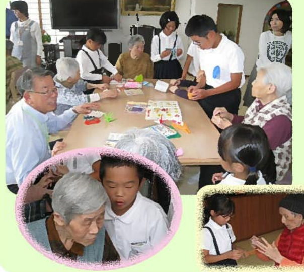
「折り紙、一緒にしよう!」