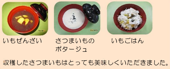
いもぜんざい さつまいものポタージュ いもごはん 収穫したさつまいもはとっても美味しくいただきました。