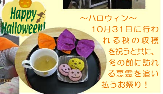
～ハロウィン～ 10月31日に行われ る秋の収穫を祝うと共に、 冬の前に訪れる悪霊を追い 払うお祭り!