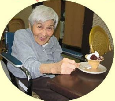
「わあ〜冷たくて美味しい!」 外出先の甘味処にて。