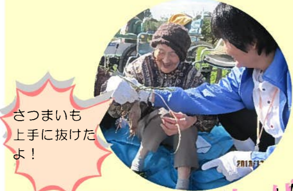
さつまいも 上手に抜けた よ!