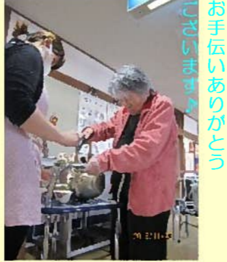
お手伝いありがとうございます