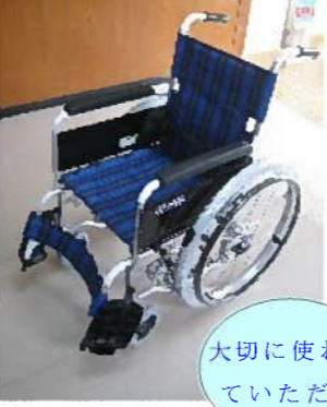
大切に使用 していただき

十二月十七日、阿知須中学校から車椅子を寄贈いただきました。御厚意に対しまして、心から感謝申し上げます。