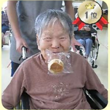
「わ〜い、1等賞!!」 苑内運動会でハッスル。