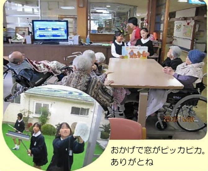
おかげで窓がピッカピカ。 ありがとね