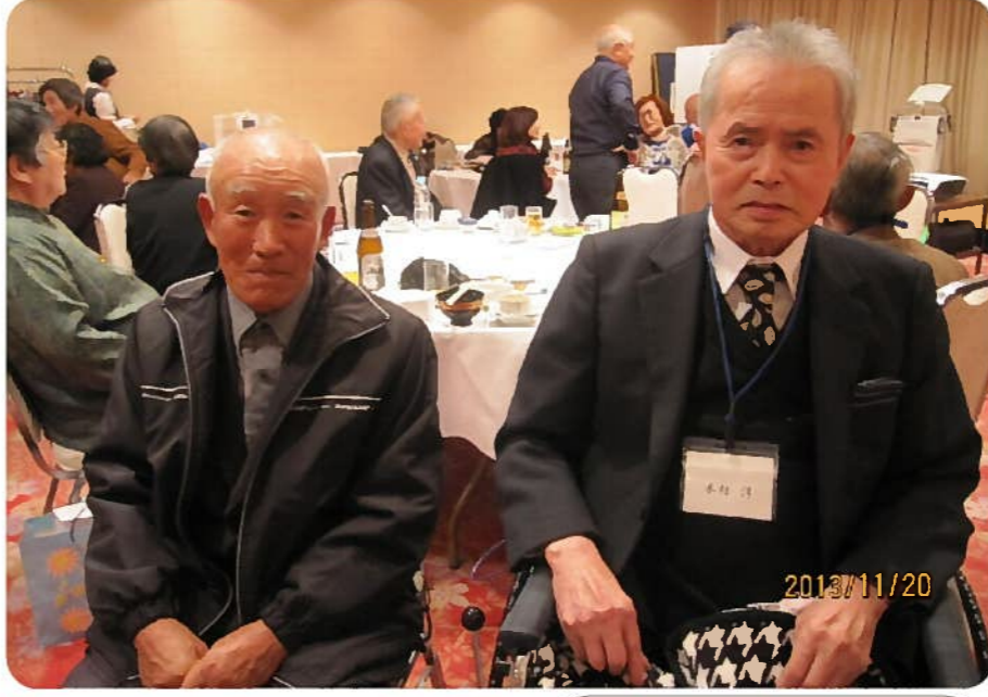
決まっています! Mr. 男前

11月20日(水)利用者様が山口グランドホテルで行われた小学校の同窓会に参加されました。初めての同窓会参加ということもあり、最初は緊張した面持ちでしたが、記念撮影が終わり歓談が進んでいくうちに打ち解けられ、旧友との再会や会食、ビンゴゲームなどを楽しまれました。