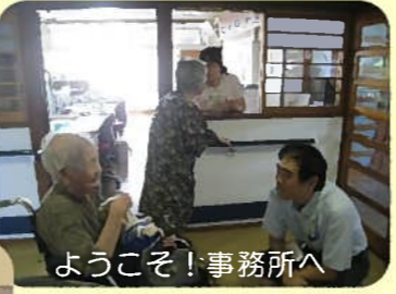
ようこそ!事務所へ