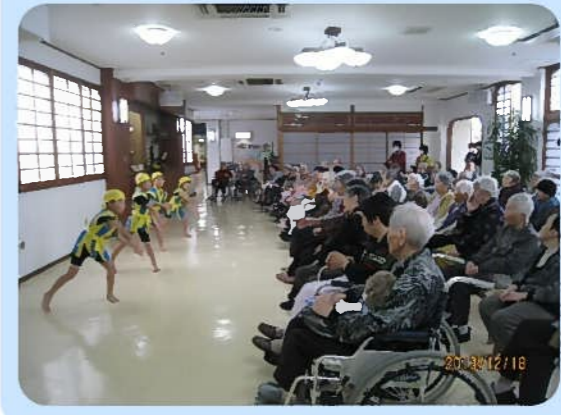
あまりの可愛さに みんなメロメロ☆