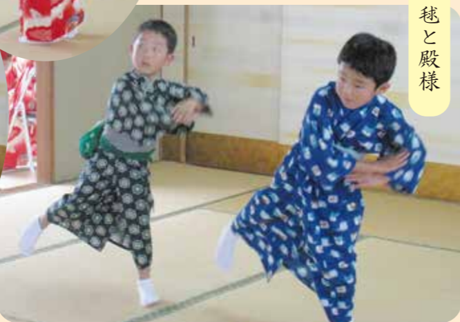
5月26日(金)可愛い踊り子たちが来苑! 一生懸命、練習をかさねた踊りを披露してくれました。