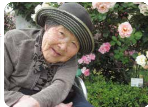
5/20(土)、5/21(日)見頃を迎えたバラの観賞に山口宇部空港に行って来ました。 満開の花にご利用者様の笑顔も満開です