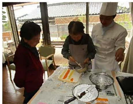
美味しいデザートを作っています。