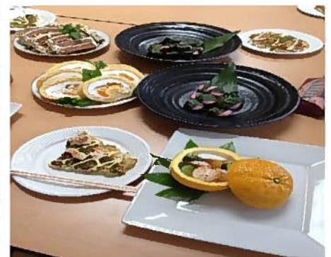
美味しい料理とデザートできました