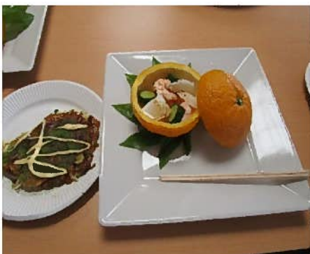
お好み焼きと夏みかんのサラダ